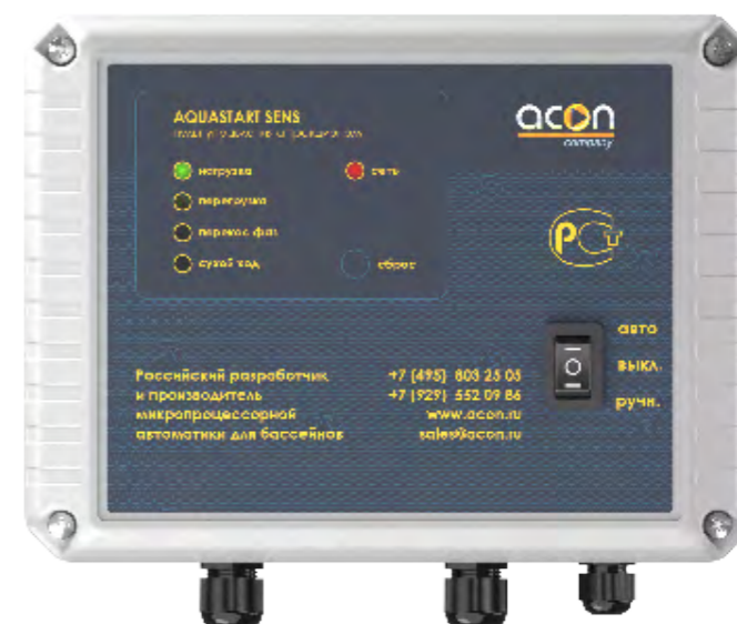
Рисунок 1 - Лицевая панель корпуса

Кнопка «СБРОС» для вывода ПУ из заблокированного состояния