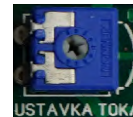
Рисунок 3 - Подстроечное сопротивление

При срабатывании какой либо защиты ПУ будет блокировать перезапуск насоса только на определенные промежутки времени. Для первого, второго и третьего срабатывания промежуток времени равен 1 мин., 5 мин. и 15 минут соответственно. Допускаются только три последовательно повторяющихся срабатывания одного вида защиты. После третьего неудачного перезапуска ПУ блокирует перезапуск насоса без ограничения времени. Прежде чем продолжать работу необходимо устранить причины срабатывания защиты. Вывод из заблокированного состояния возможен нажатием кнопки «СБРОС».